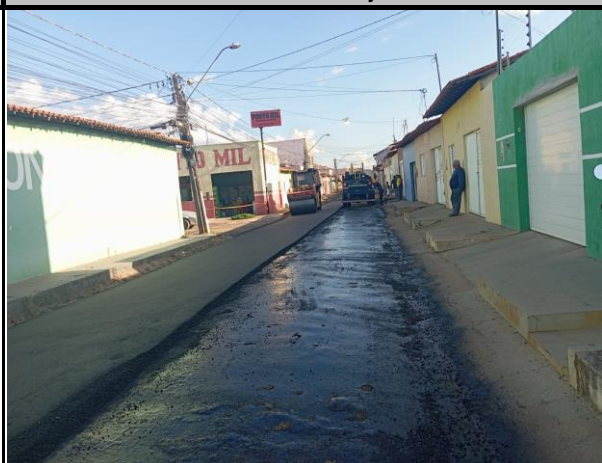
Rua General Gurjão