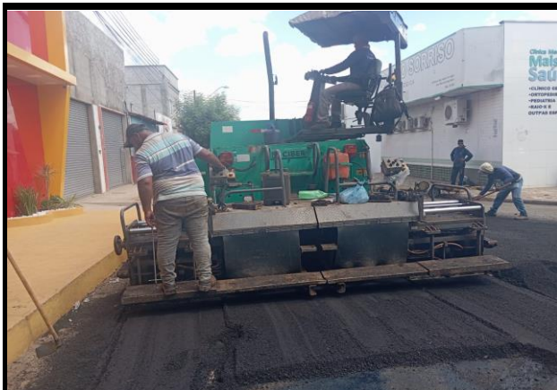
Rua General Gurjão