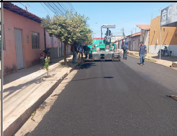
Rua General Gurjão