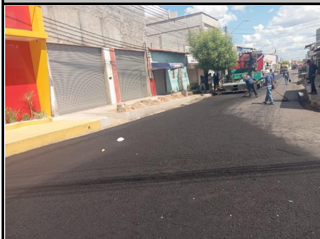
Rua General Gurjão