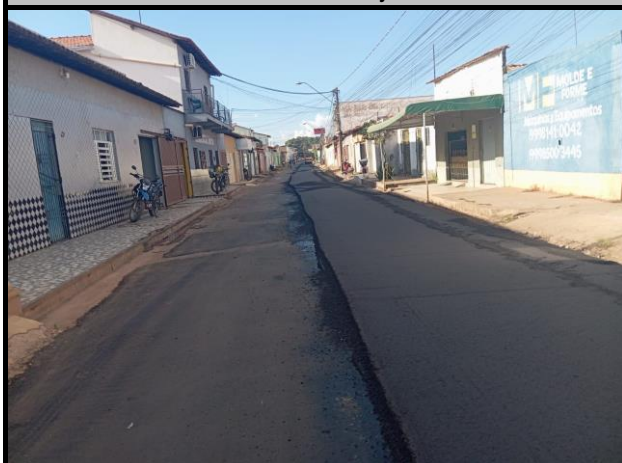
Rua General Gurjão