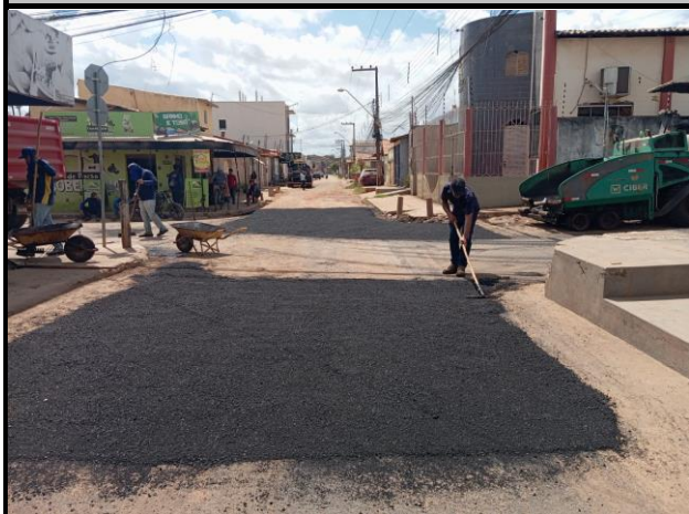
Rua Coriolano Milhomem