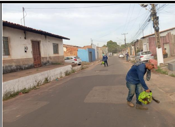
Rua João Pessoa