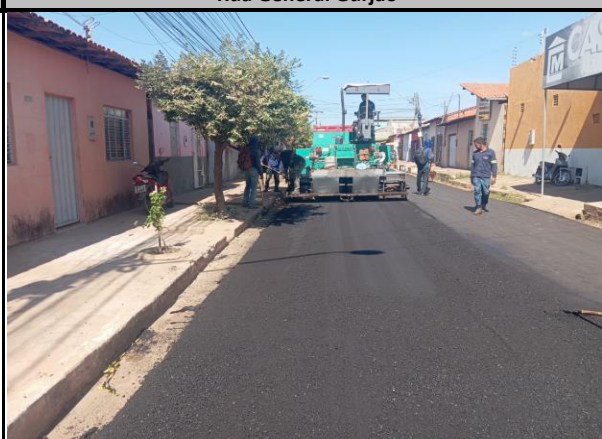
Rua General Gurjão