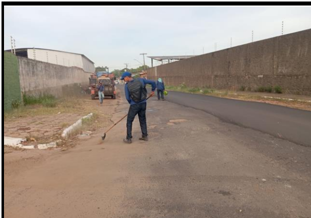
Rua João Pessoa