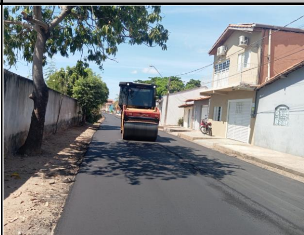
Rua Coriolano Milhomem