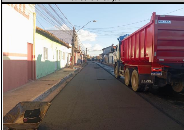
Rua General Gurjão