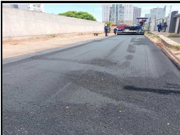
Rua Senador Millet