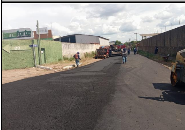
Rua João Pessoa