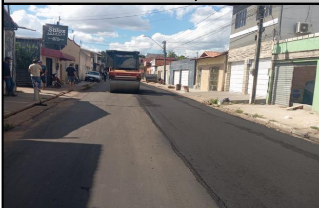
Rua General Gurjão