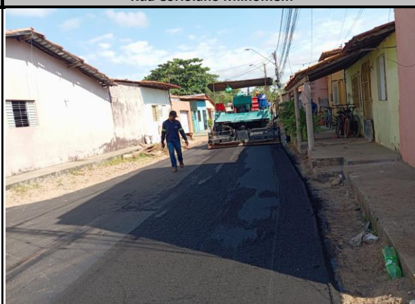
Rua Coriolano Milhomem