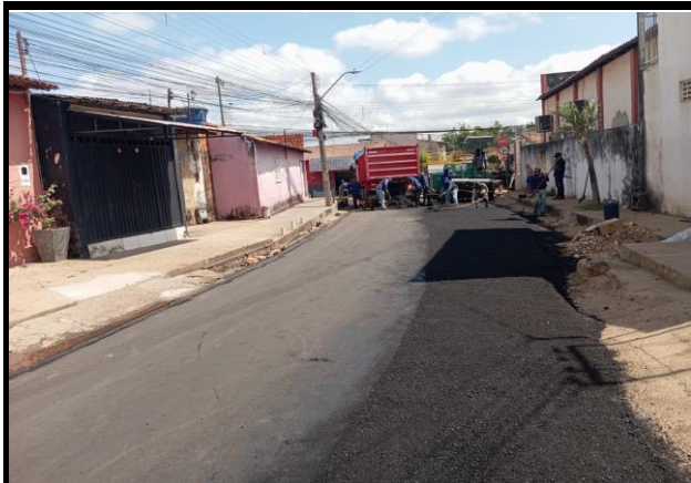
Rua Coriolano Milhomem