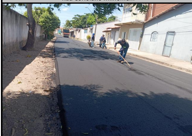
Rua Coriolano Milhomem