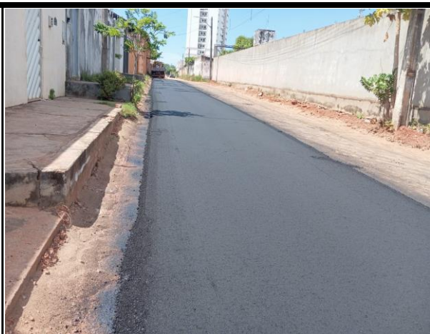
Rua Senador Millet