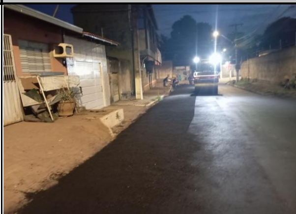
Rua João Pessoa