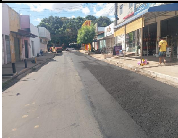
Rua General Gurjão