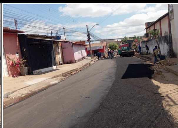
Rua Coriolano Milhomem