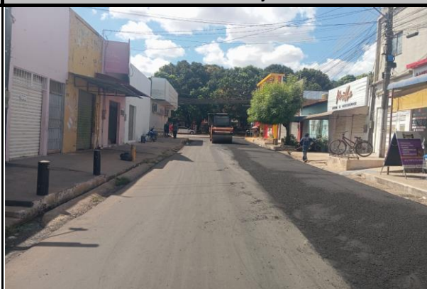
Rua General Gurjão