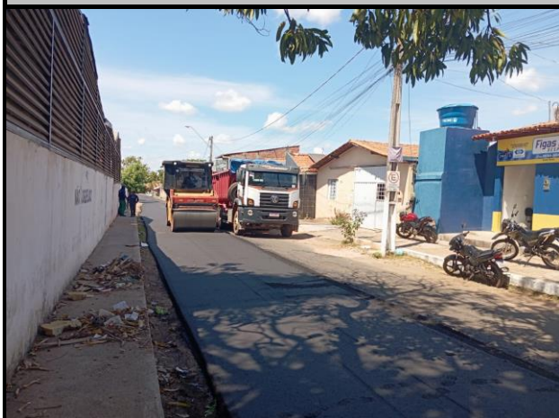
Rua Coriolano Milhomem