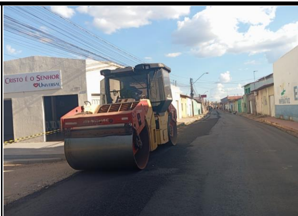
Rua General Gurjão