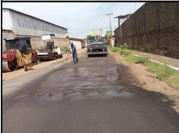
Rua João Pessoa