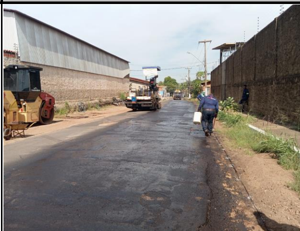
Rua João Pessoa