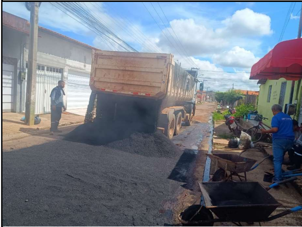
RUA 11 - 10/04/2026