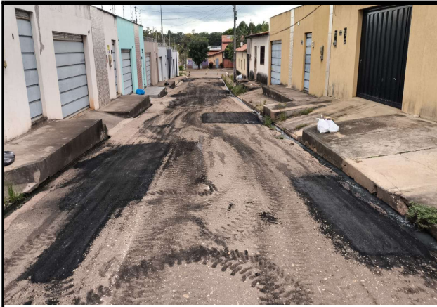
RUA 1 DE MAIO - 15/04/2026