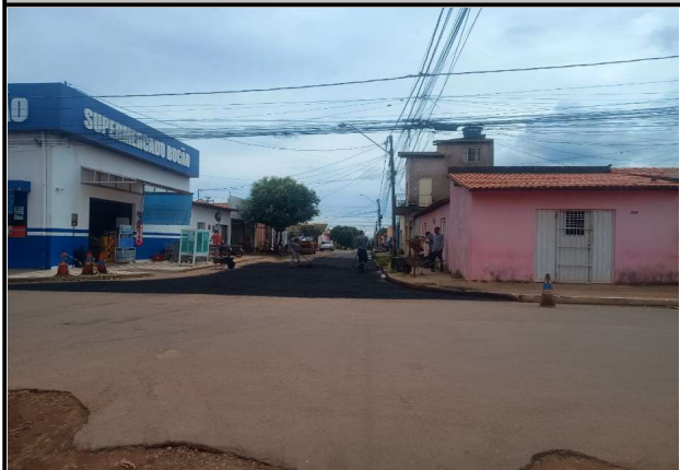
RUA SÃO JOSE - 15/04/2026