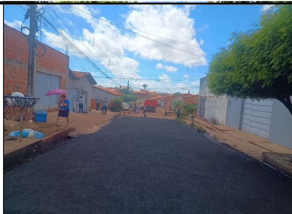
RUA SÃO JOSE - 29/04/2026