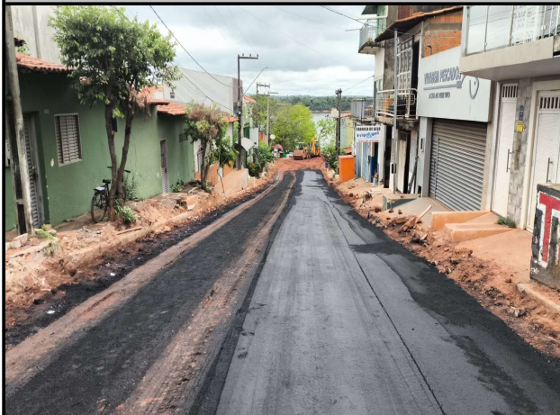
RUA GONÇALVES DIAS - 18/04/2026