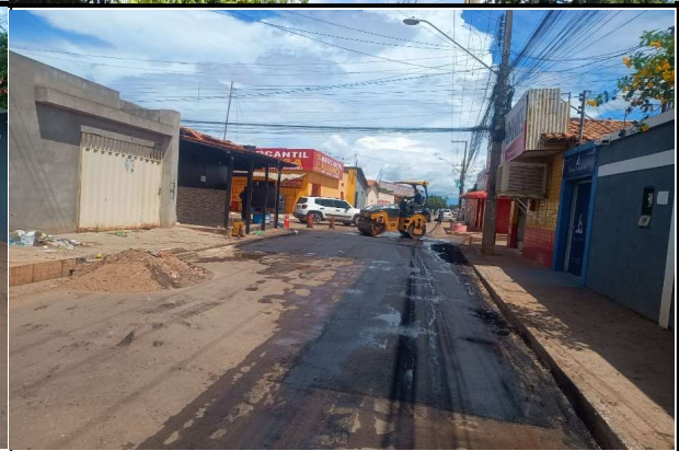
RUA 11 - 08/04/2026