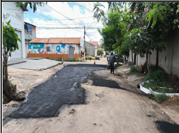
RUA ACASSIO PEREIRA DE CASTRO - 10/04/2026