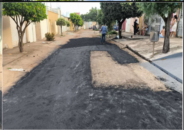
RUA ACASSIO PEREIRA DE CASTRO - 14/04/2026