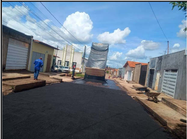
RUA SÃO JOSE - 16/04/2026