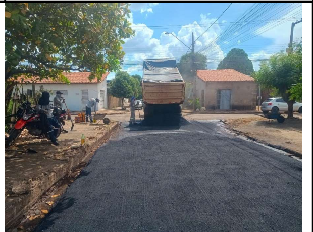
RUA SÃO JOSE - 14/04/2026