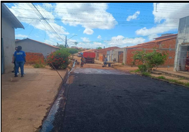
RUA SÃO JOSE - 29/04/2026