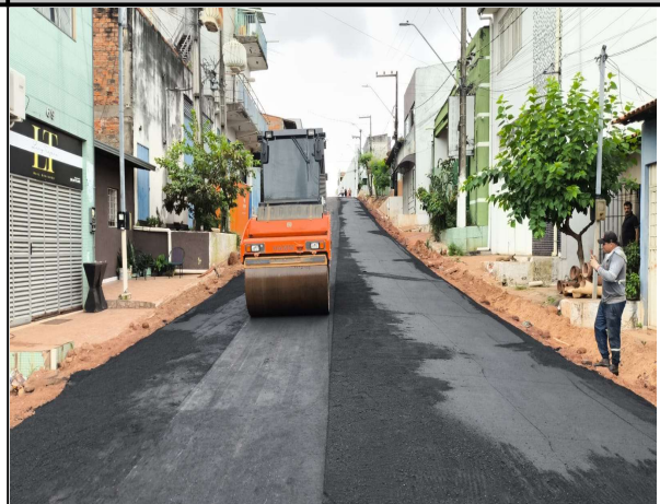
RUA GONÇALVES DIAS - 18/04/2026