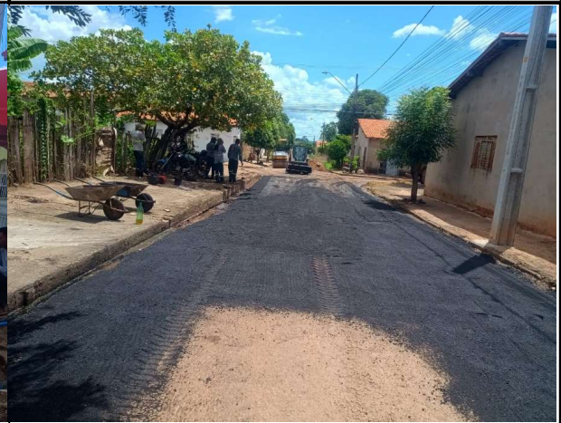
RUA 11 - 10/04/2026