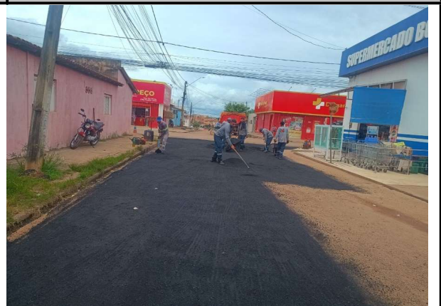
RUA SÃO JOSE - 15/04/2026