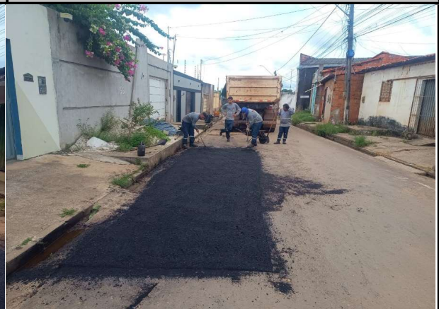
RUA 14 - 06/04/2026