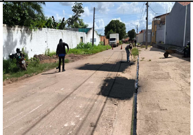
RUA ACASSIO PEREIRA DE CASTRO - 16/03/2026