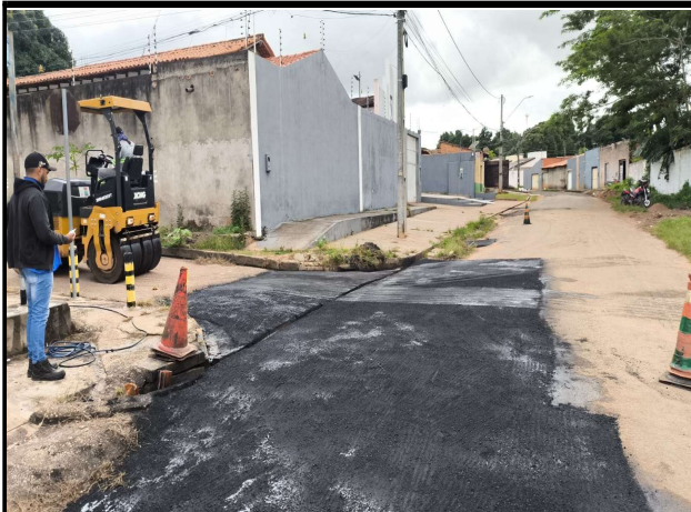
RUA ACASSIO PEREIRA DE CASTRO - 17/04/2026