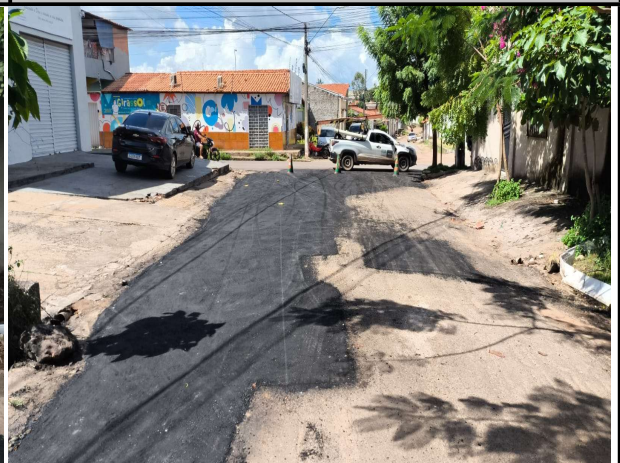
RUA ACASSIO PEREIRA DE CASTRO - 10/04/2026