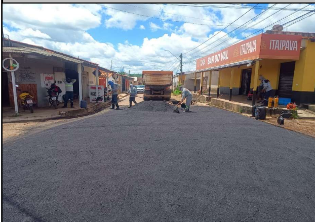
RUA 14 - 07/04/2026