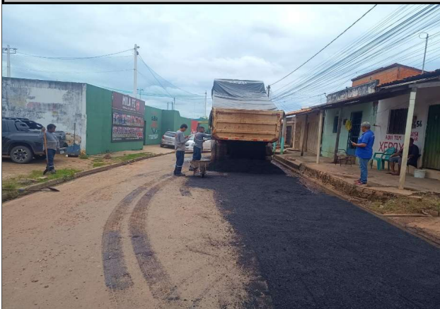
RUA 14 - 06/04/2026