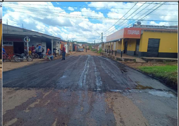
RUA 14 - 07/04/2026