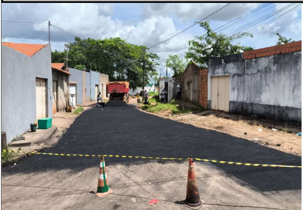
RUA ACASSIO PEREIRA DE CASTRO - 16/04/2026