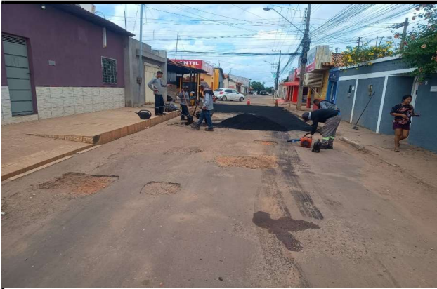
RUA 11 - 08/04/2026