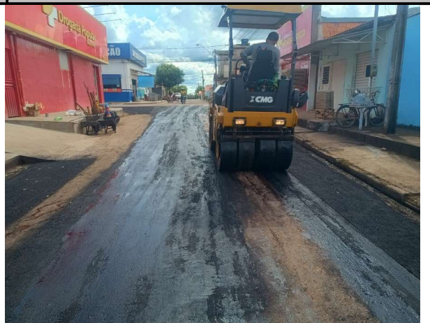
RUA SÃO JOSE - 16/04/2026