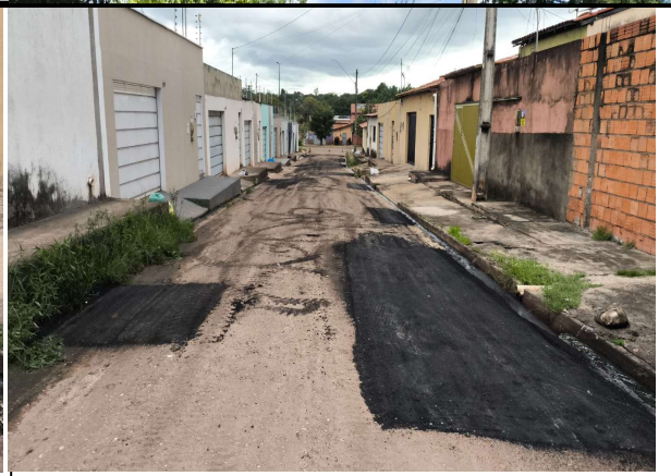
RUA 1 DE MAIO - 15/04/2026