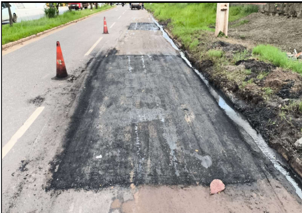
AV. JK - 01/04/2026