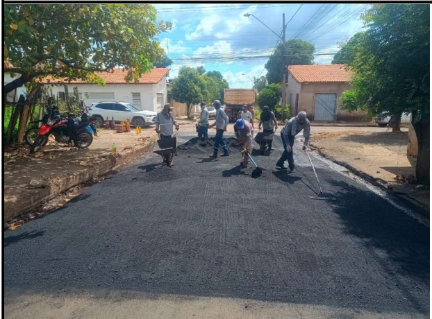
RUA SÃO JOSE - 14/04/2026