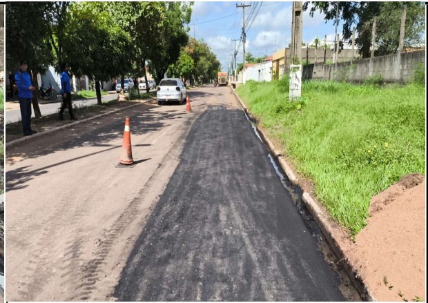
AV. JK - 01/04/2026