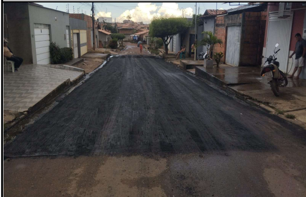
RUA SÃO JOSE - 27/04/2026