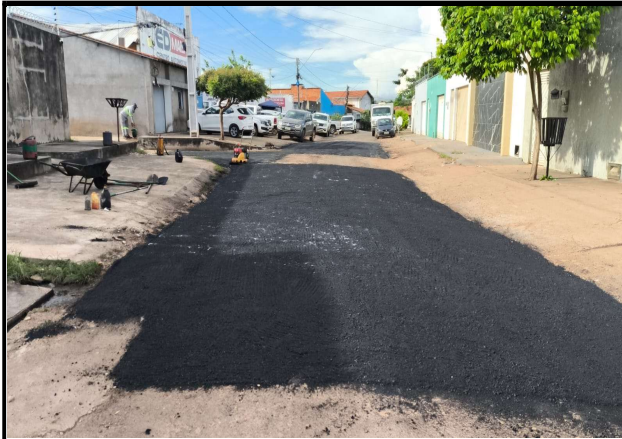
RUA ACASSIO PEREIRA DE CASTRO - 14/04/2026