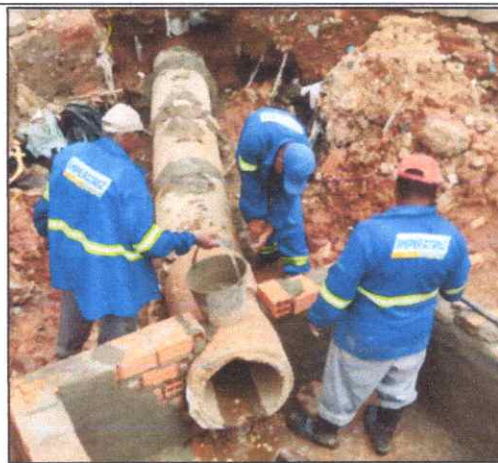
Foto 38 - TUBO DE CONCRETO ARMADO PA2 - D= 0,60 M.