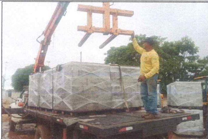
Foto 5 - BLOCO DE CONCRETO ESTRUTURAL 19X19X39 CM, FBK 10 MPA.