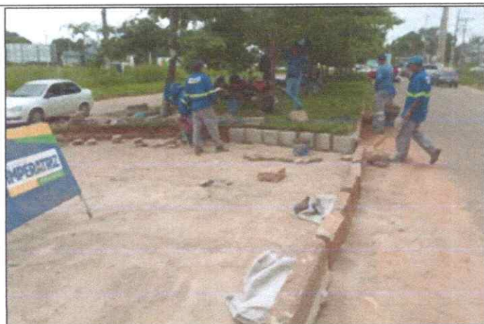
Foto 27 - MEIO-FIO OU GUIA DE CONCRETO, PRE-MOLDADO, COMP 80 CM, 45 X 12/18 CM.