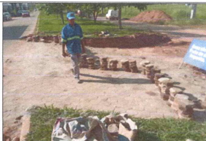
Foto 24 - BLOQUETE/PISO INTERTRAVADO DE CONCRETO - MODELO SEXTAVADO / HEXAGONAL, 25 CM X 25 CM, E = 8 CM, RESISTENCIA DE 35 MPA.