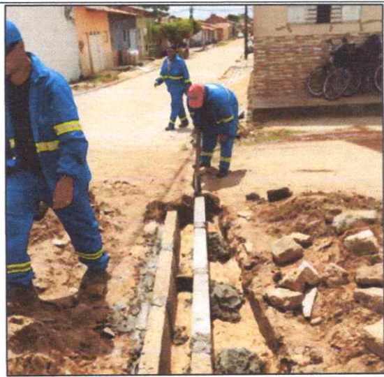
Foto 22 - MEIO-FIO OU GUIA DE CONCRETO, PRE-MOLDADO, COMP 80 CM, 45 X 12/18 CM.