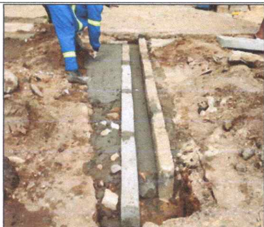
Foto 23 - MEIO-FIO OU GUIA DE CONCRETO, PRE-MOLDADO, COMP 80 CM, 45 X 12/18 CM.