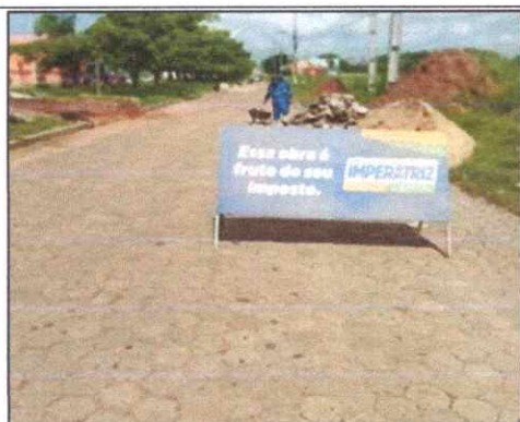
Foto 25 - BLOQUETE/PISO INTERTRAVADO DE CONCRETO - MODELO SEXTAVADO / HEXAGONAL, 25 CM X 25 CM, E = 8 CM, RESISTENCIA DE 35 MPA.