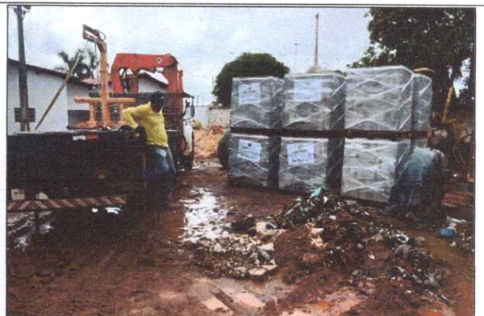
Foto 6 - BLOCO DE CONCRETO ESTRUTURAL 19X19X39 CM, FBK 10 MPA.