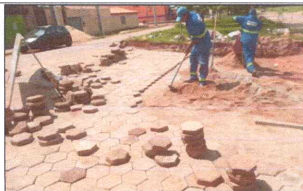
Foto 26 - BLOQUETE/PISO INTERTRAVADO DE CONCRETO - MODELO SEXTAVADO / HEXAGONAL, 25 CM X 25 CM, E = 8 CM, RESISTENCIA DE 35 MPA.