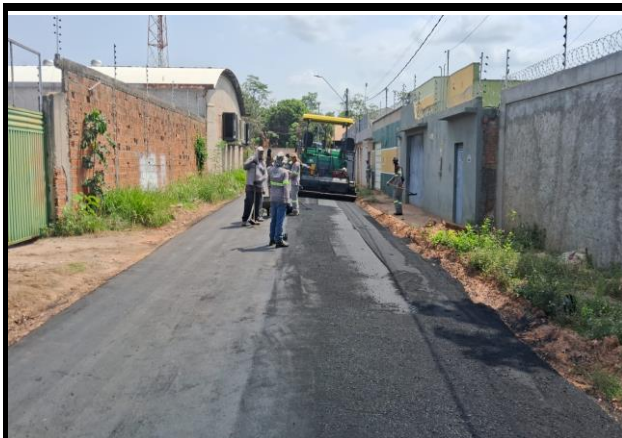
Rua Campos Sales - Vila Parati