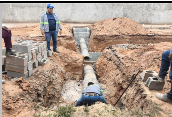
Avenida Bayma Junior