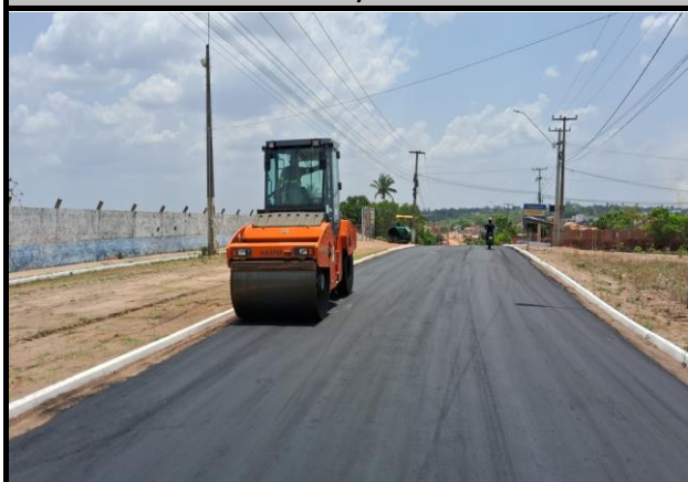
Avenida Bayma Junior