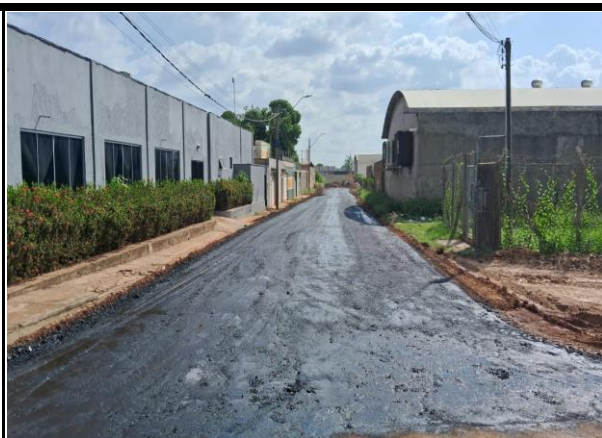
Rua Campos Sales - Vila Parati