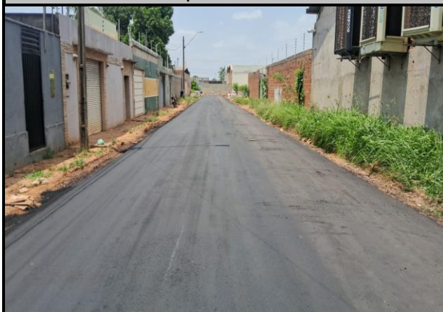
Rua Campos Sales - Vila Parati