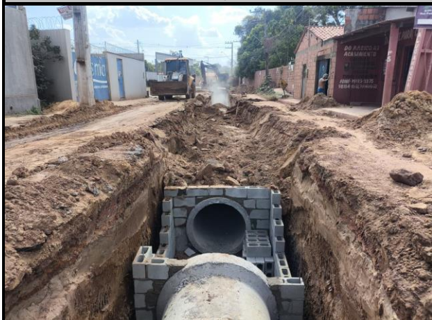
Avenida Bayma Junior