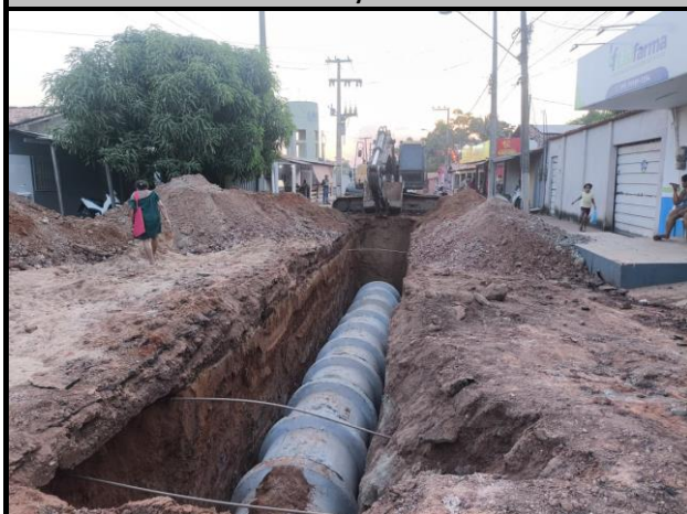
Avenida Bayma Junior