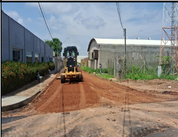
Rua Campos Sales - Vila Parati