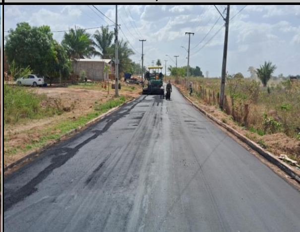
Avenida Bayma Junior