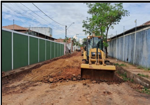
Rua Vinicius de Moraes - Vila Parati