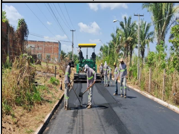
Avenida Bayma Junior