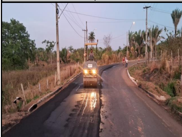
Avenida Bayma Junior