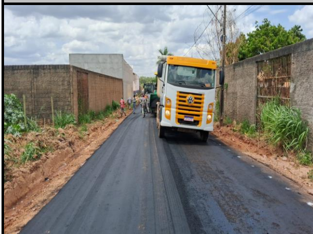
Rua Vinicius de Moraes - Vila Parati