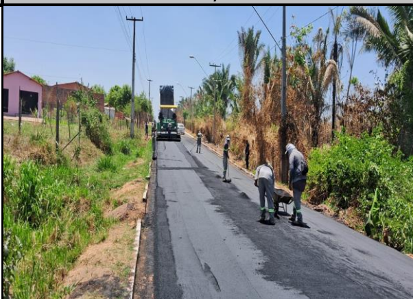
Avenida Bayma Junior