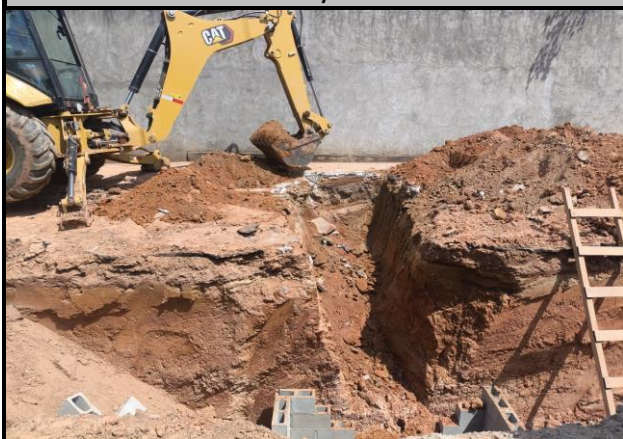
Avenida Bayma Junior