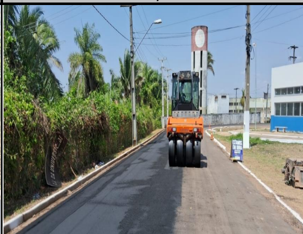
Avenida Bayma Junior