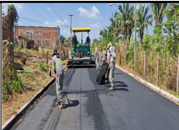
Avenida Bayma Junior