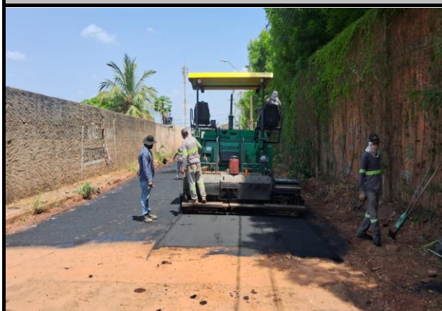
Rua E - Vila Parati