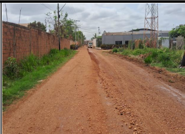
Rua E - Vila Parati