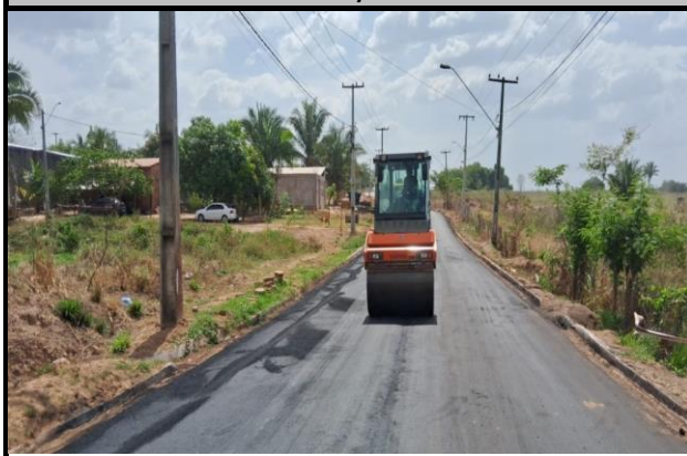
Avenida Bayma Junior