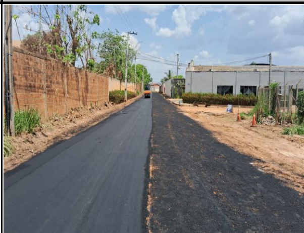
Rua E - Vila Parati