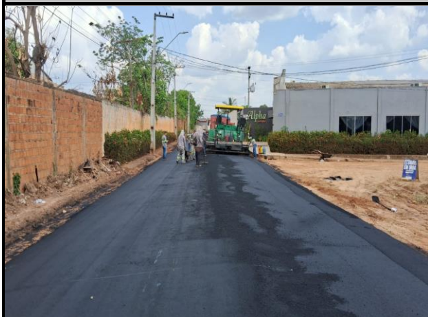
Rua E - Vila Parati