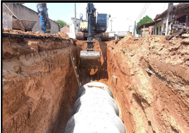
Avenida Bayma Junior