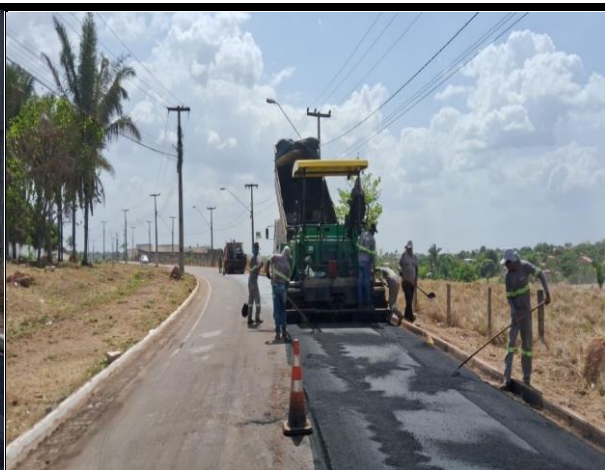
Avenida Bayma Junior