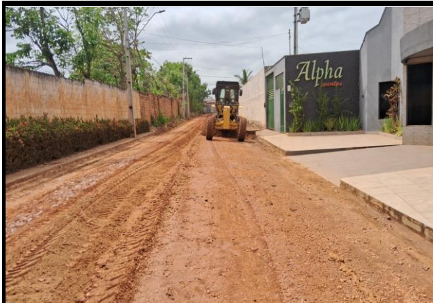
Rua E - Vila Parati