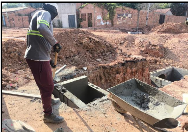
Avenida Bayma Junior