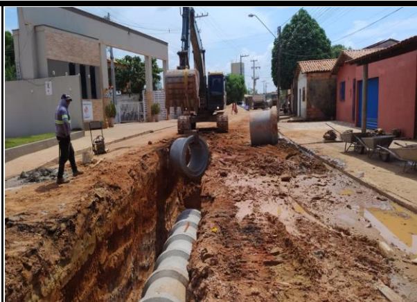
Avenida Bayma Junior