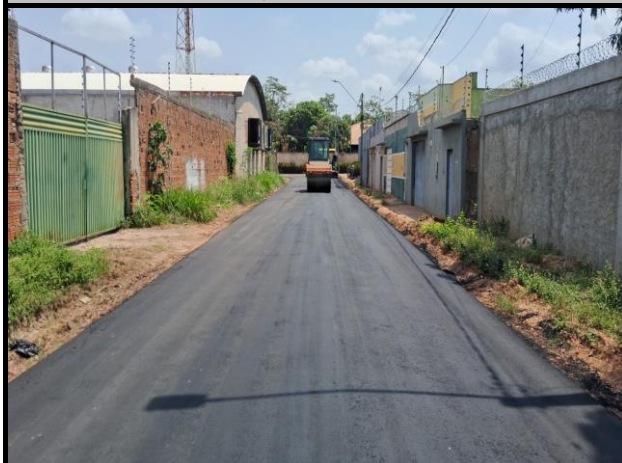
Rua Campos Sales - Vila Parati