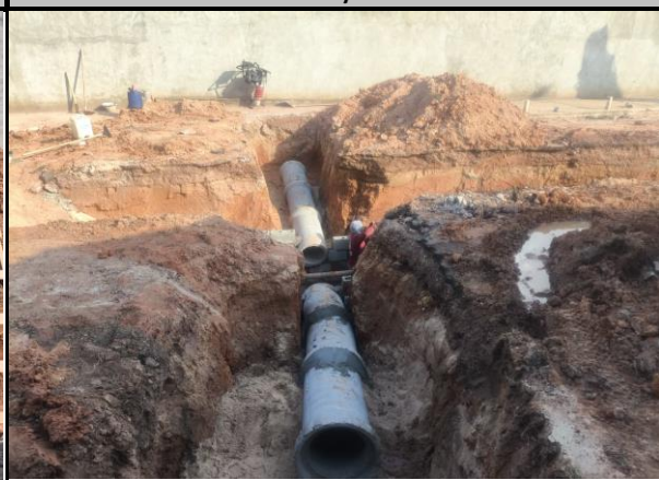
Avenida Bayma Junior