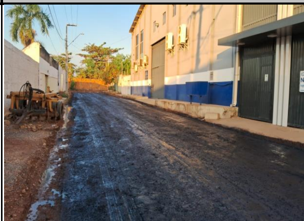
Rua Vinicius de Moraes - Vila Parati