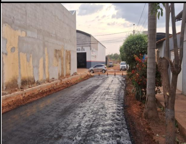
Rua Vinicius de Moraes - Vila Parati

VITOR LEAL DE SOUSA Fiscal do Contrato Matrícula - 85.335-5