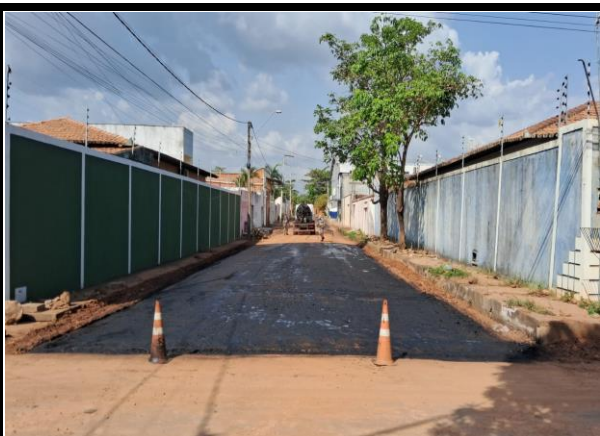
Rua Vinicius de Moraes - Vila Parati