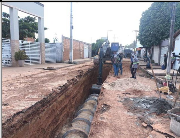
Avenida Bayma Junior