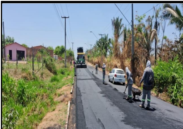
Avenida Bayma Junior