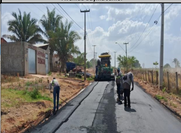
Avenida Bayma Junior