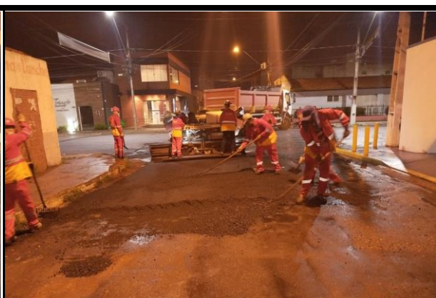
Rua Rui Barbosa (Centro)