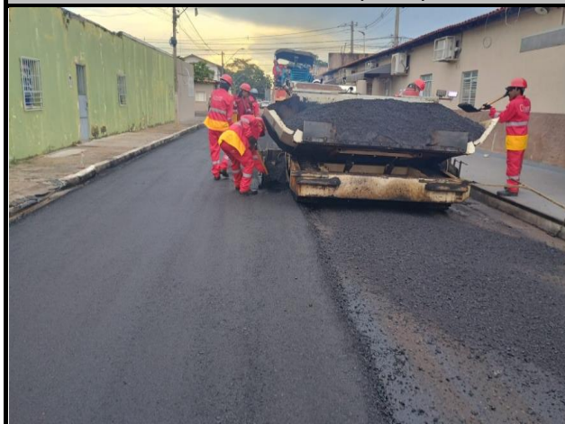
Rua Hermes da Fonseca (Centro)