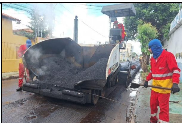
Rua Bom Jesus (Centro)