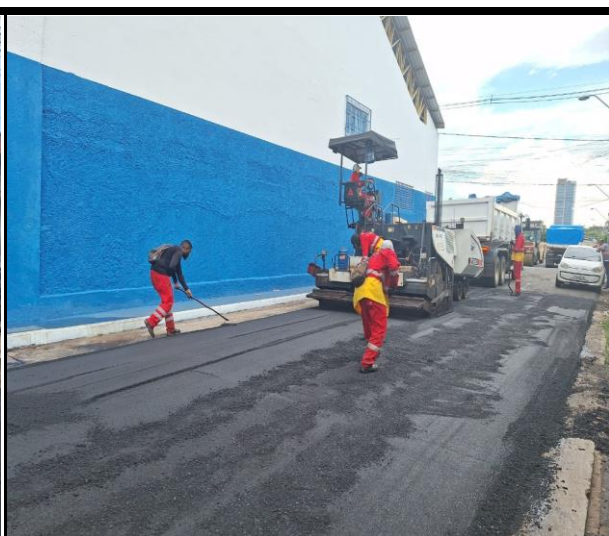
Rua Barão do Rio Branco (Centro)