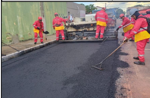
Rua Hermes da Fonseca (Centro)