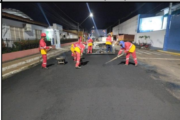
Rua Rui Barbosa x Rua Coronel Manoel Bandeira (Centro)