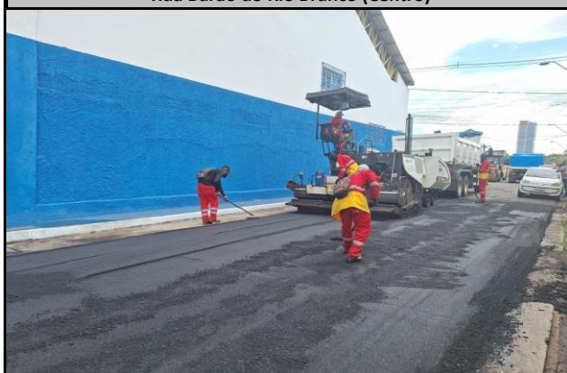
Rua Barão do Rio Branco (Centro)