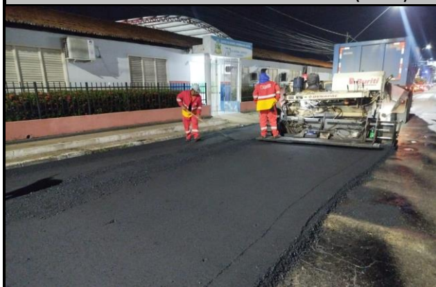
Rua Rui Barbosa x Rua Coronel Manoel Bandeira (Centro)