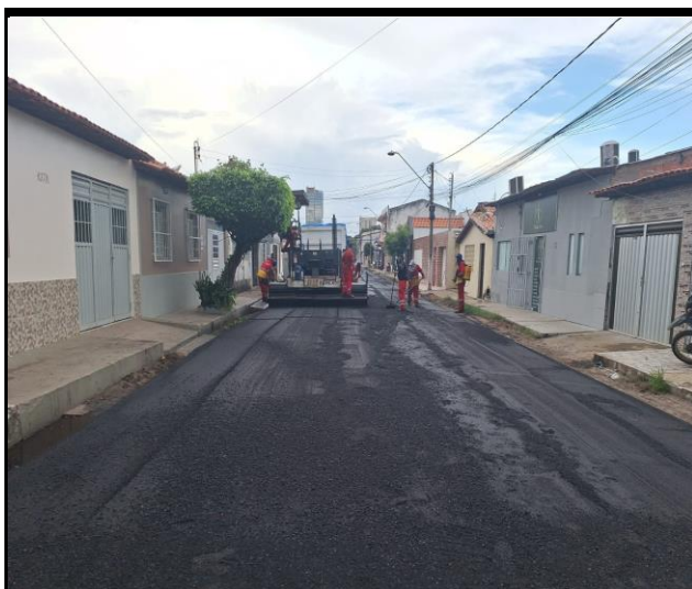
Rua Barão do Rio Branco (Centro)