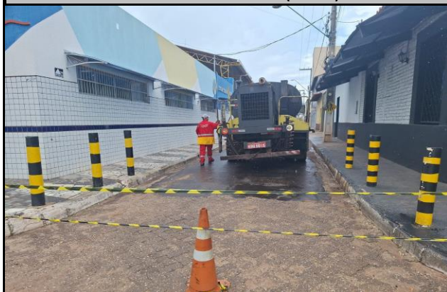
Rua Barão do Rio Branco (Centro)