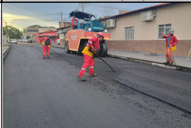
Rua Hermes da Fonseca (Centro)