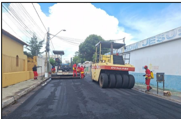
Rua Bom Jesus (Centro)