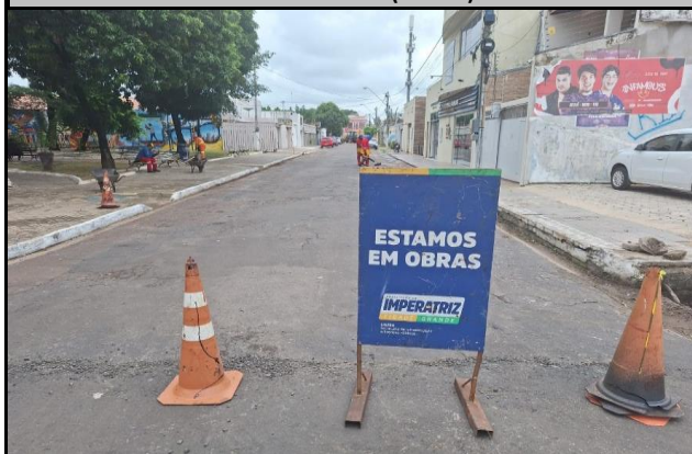
Rua Bom Jesus (Centro)