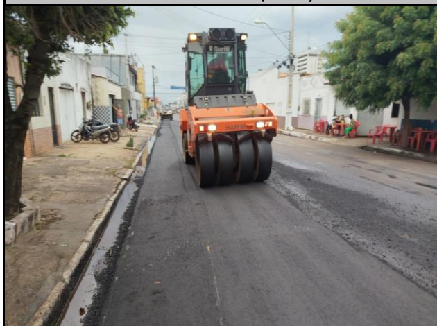
Rua Benedito Leite (Centro)