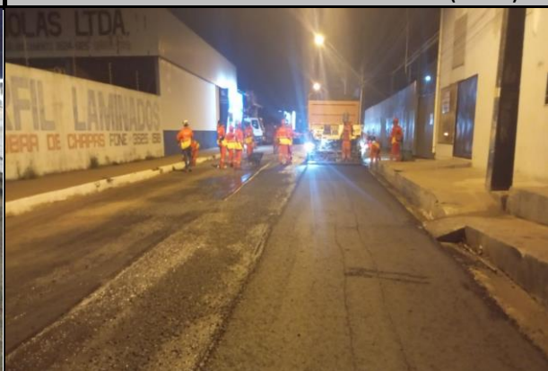
Rua Benedito Leite (Centro)