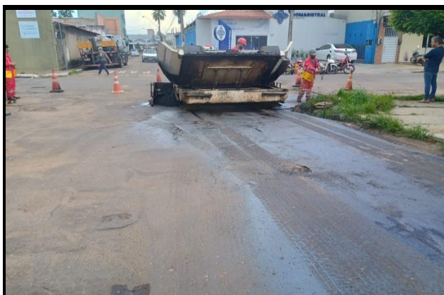
Rua Hermes da Fonseca (Centro)