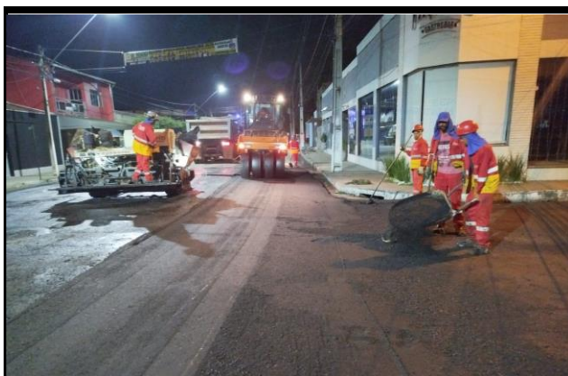
Rua Barão do Rio Branco x Rua Coronel Manoel Bandeira