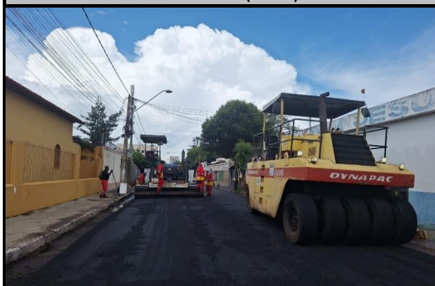
Rua Bom Jesus (Centro)