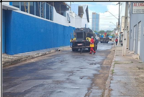
Rua Barão do Rio Branco (Centro)