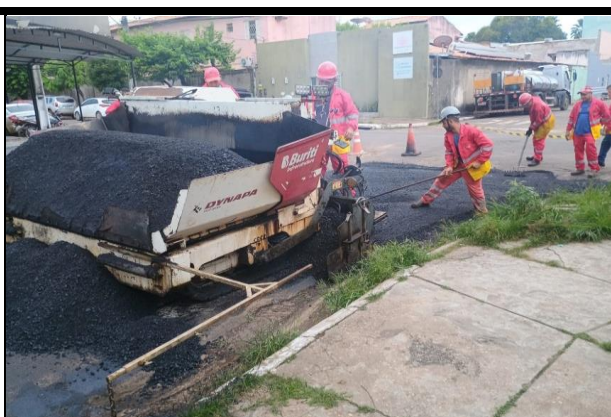
Rua Hermes da Fonseca (Centro)