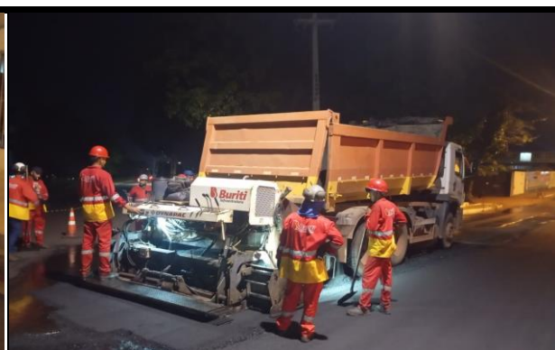
Rua Benedito Leite (Centro)