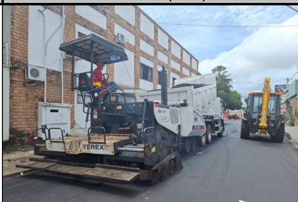
Rua Bom Jesus (Centro)