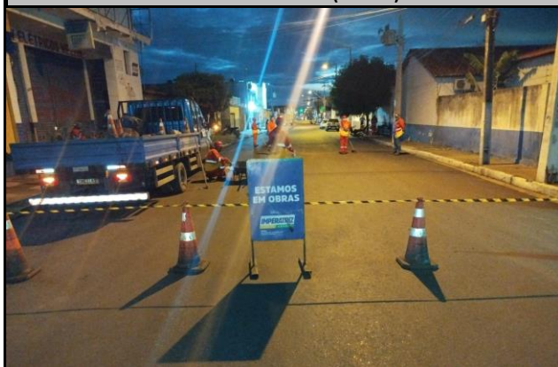
Rua Benedito Leite (Centro)