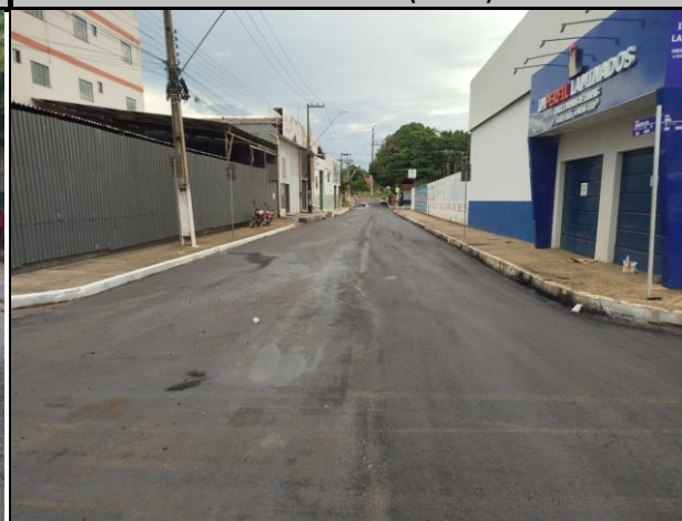
Rua Benedito Leite (Centro)