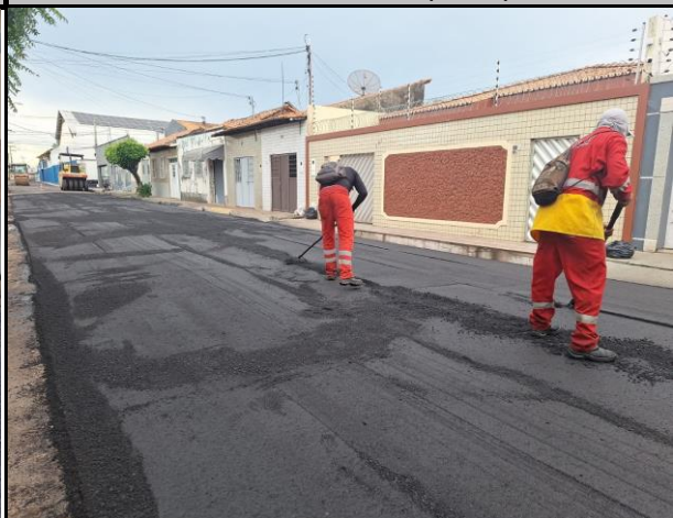
Rua Barão do Rio Branco (Centro)