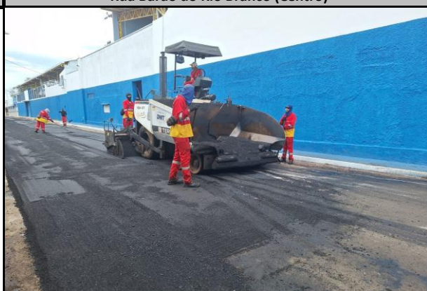
Rua Barão do Rio Branco (Centro)