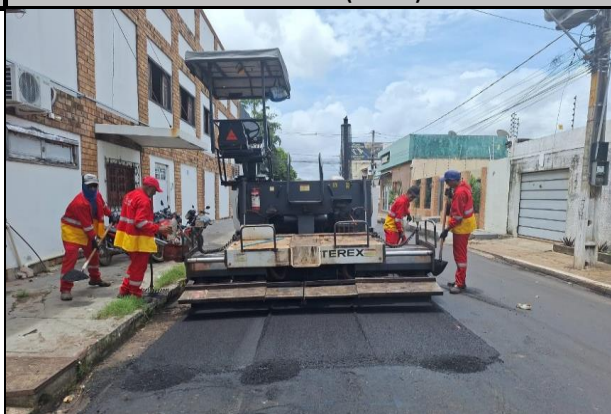
Rua Bom Jesus (Centro)