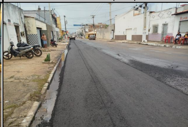
Rua Benedito Leite (Centro)