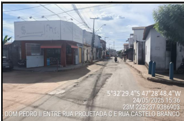
Rua Dom Pedro II