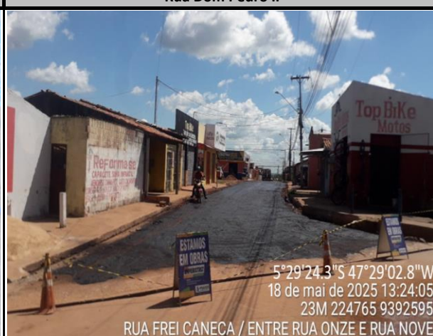
Rua Frei Caneca