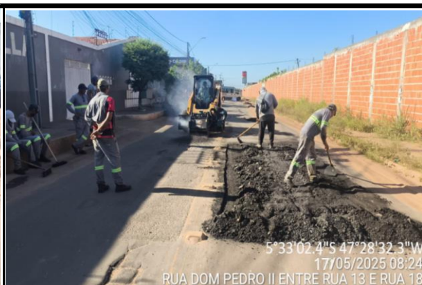
Rua Dom Pedro II