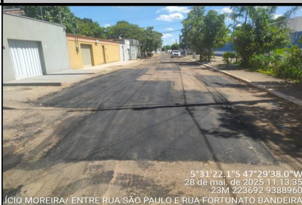
Rua Simplício Moreira