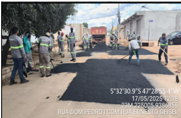
Rua Dom Pedro I