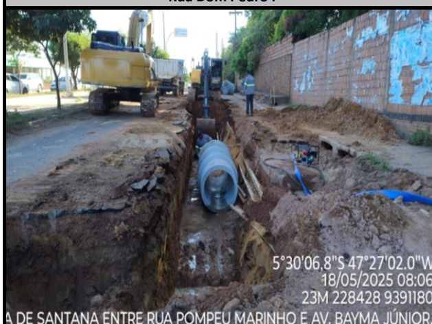
Avenida Pedro Neiva de Santana