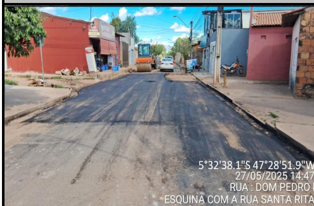
Rua Dom Pedro I