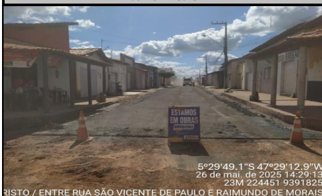
Rua Dom Evaristo Arnis