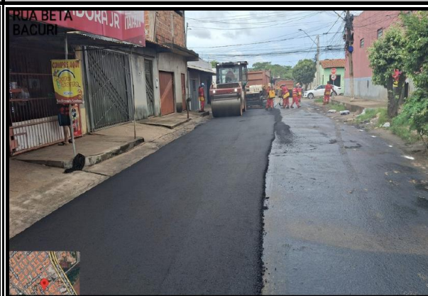
RUA BETA - BACURI

5°32'17,508"S 47°28'29,958"W R. Beta, 398 - Bacuri, Imperatriz - MA, 65916-100, Brasil RECAPEAMENTO: RUA BETA