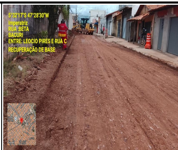
RUA BETA - BACURI