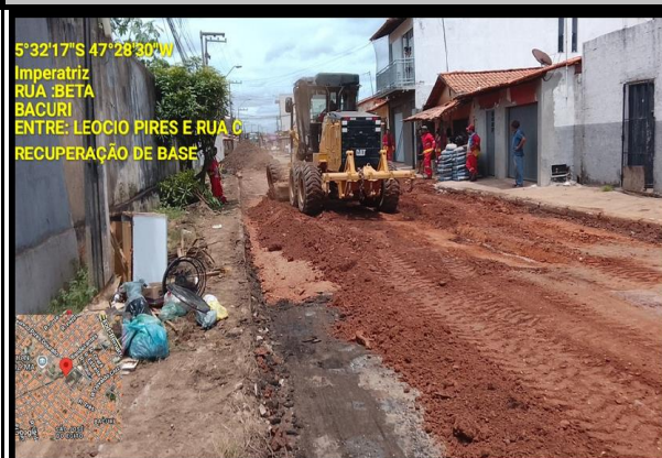
RUA BETA - BACURI