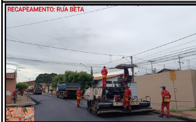
RUA BETA - BACURI