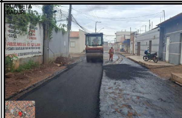
RUA BETA - BACURI