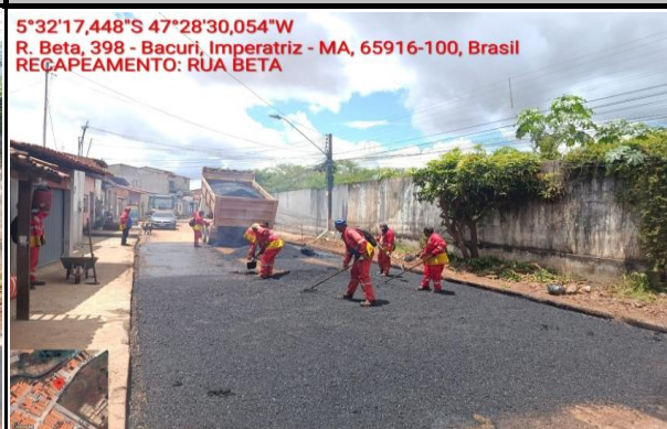
RUA BETA - BACURI