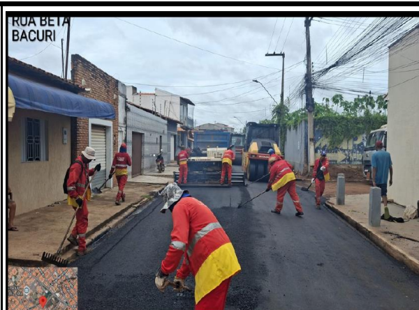
RUA BETA - BACURI