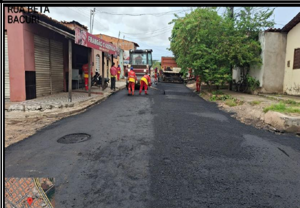
RUA BETA - BACURI