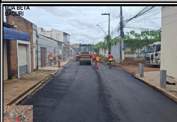
RUA BETA - BACURI