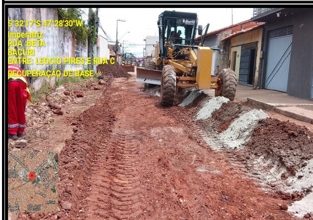
RUA BETA - BACURI