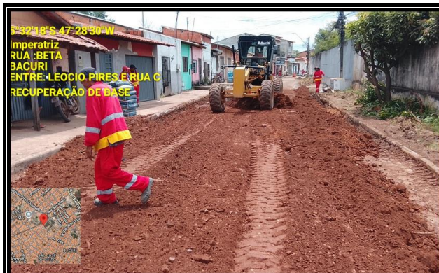
RUA BETA - BACURI