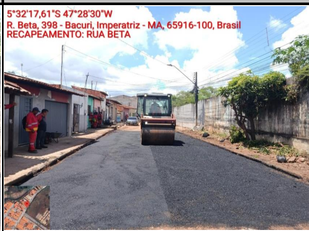
RUA BETA - BACURI