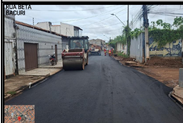
RUA BETA - BACURI