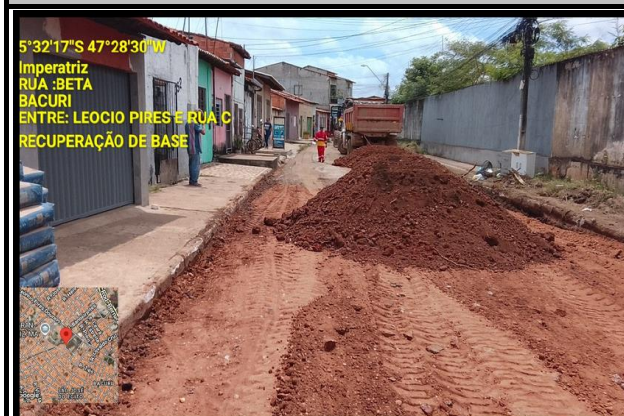
RUA BETA - BACURI