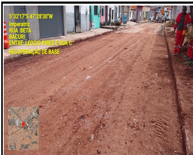
RUA BETA - BACURI