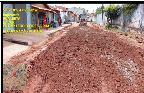
RUA BETA - BACURI