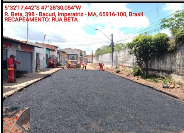
RUA BETA - BACURI