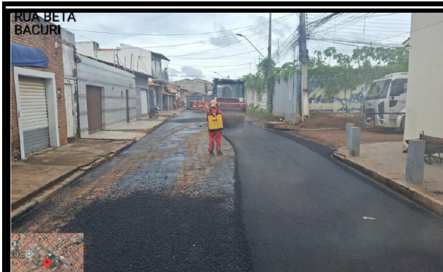
RUA BETA - BACURI