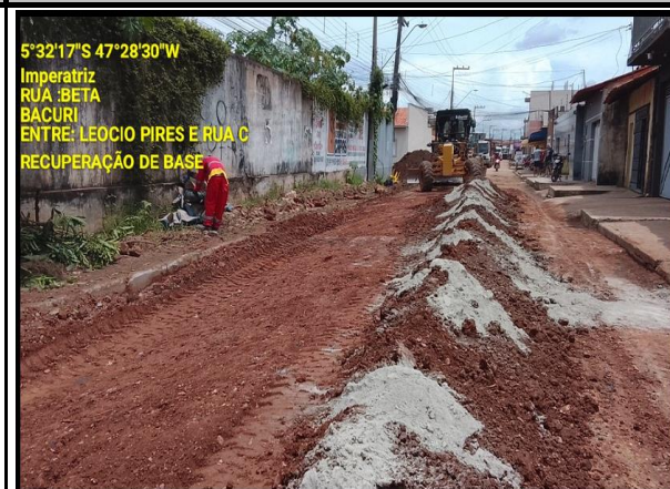
RUA BETA - BACURI