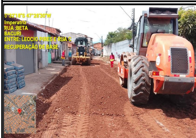
RUA BETA - BACURI