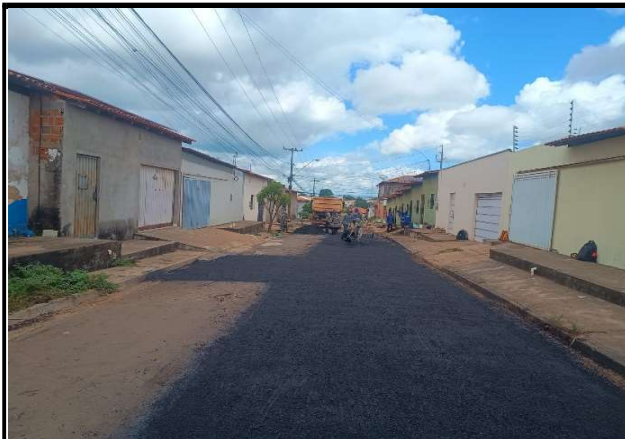
RUA PADRE ANCHIETA - 18/05/2026