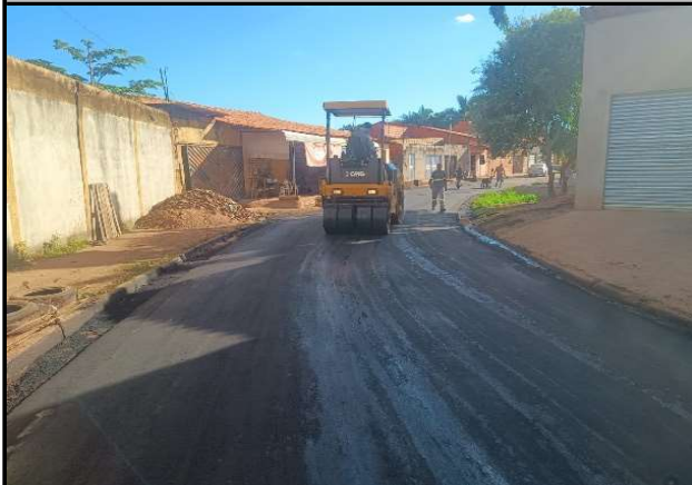
RUA SÃO JOSE - 08/05/2026