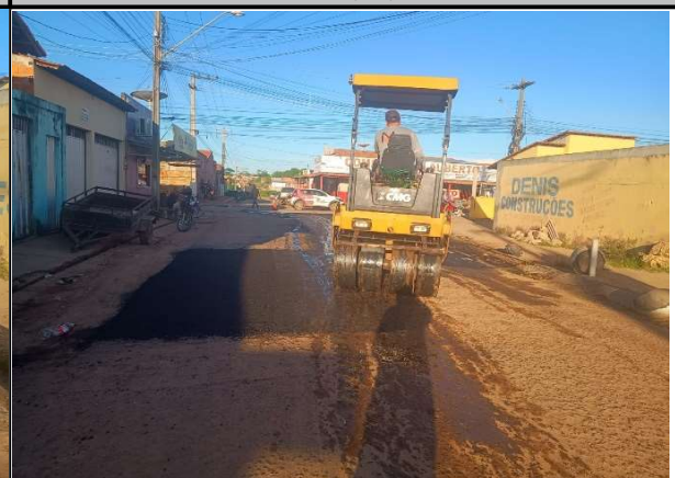
RUA TIRADENTES - 21/05/2026