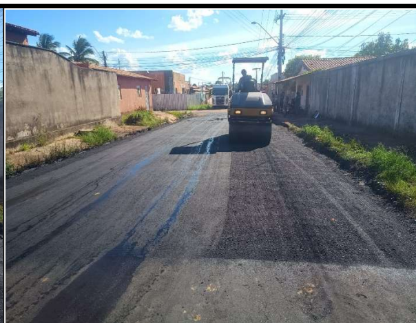
RUA TIRADENTES - 22/05/2026