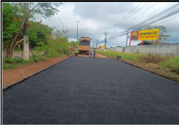
AV. JK - 15/05/2026