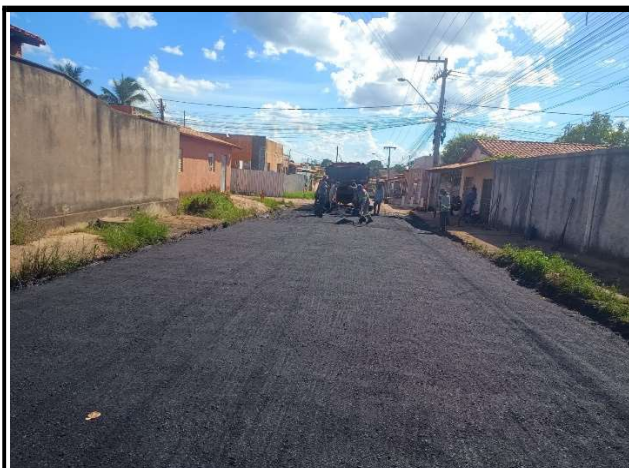
RUA TIRADENTES - 22/05/2026