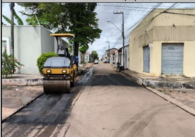
RUA 11 - 18/05/2026