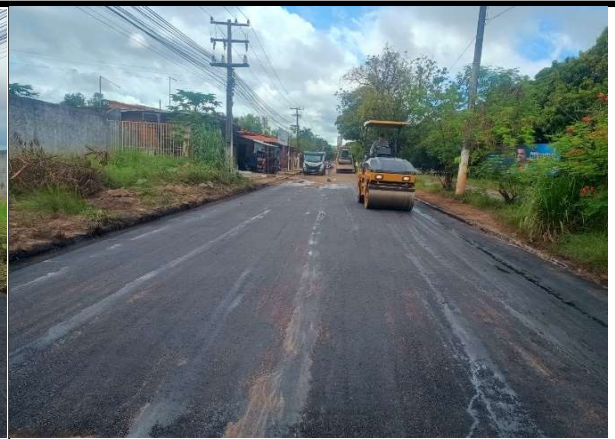
AV. JK - 15/05/2026