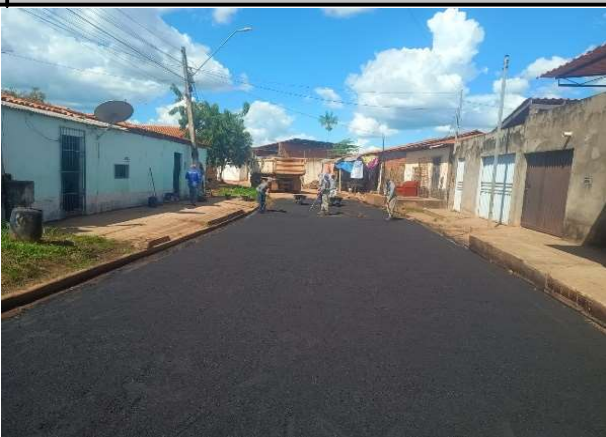
RUA SÃO JOSE - 06/05/2026