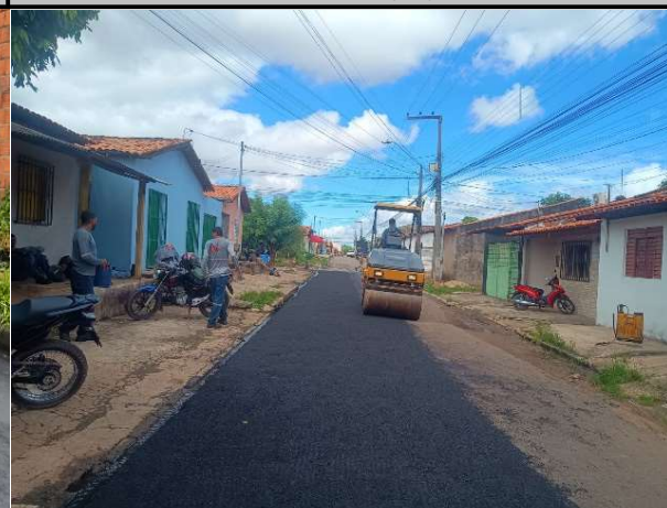
RUA 11 - 14/05/2026