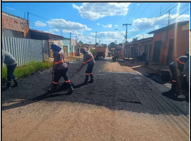
RUA TIRADENTES - 26/05/2026