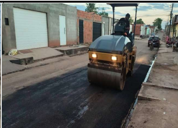
RUA 11 - 28/05/2026