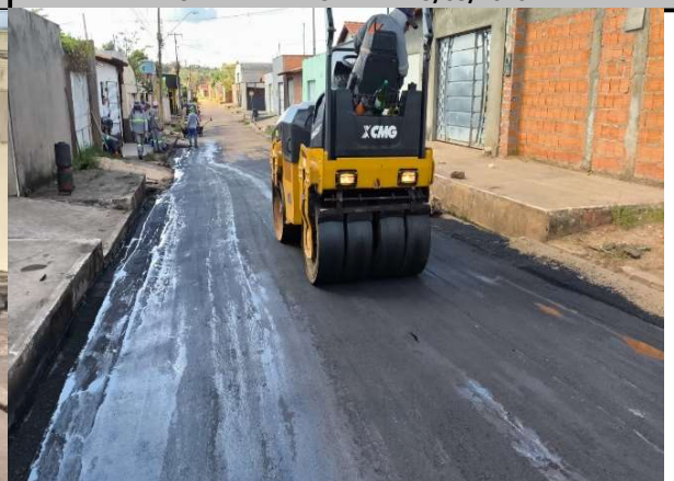
RUA 11 - 18/05/2026