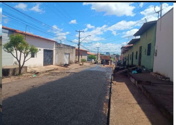
RUA PADRE ANCHIETA - 18/05/2026