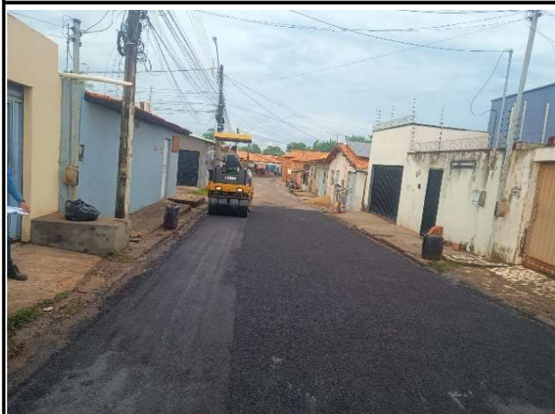
RUA SÃO JOSE - 13/05/2026