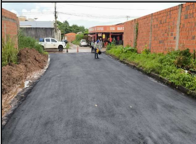
RUA ACASSIO PEREIRA DE CASTRO - 13/05/2026