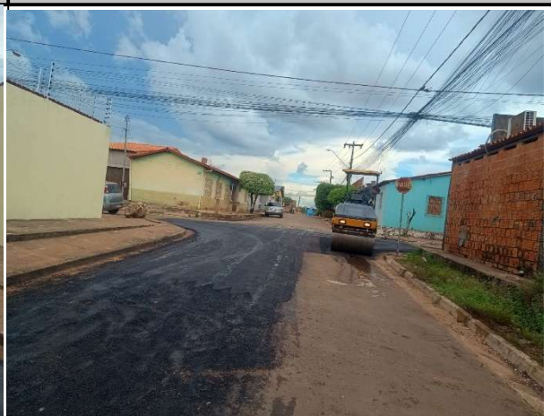
RUA PADRE ANCHIETA - 15/05/2026