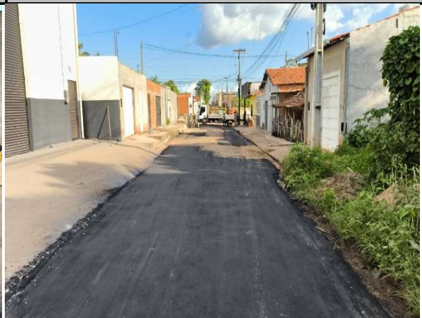
RUA 11 - 21/05/2026