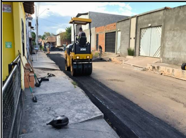
RUA 11 - 21/05/2026