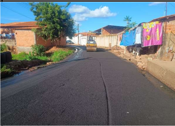
RUA SÃO JOSE - 08/05/2026