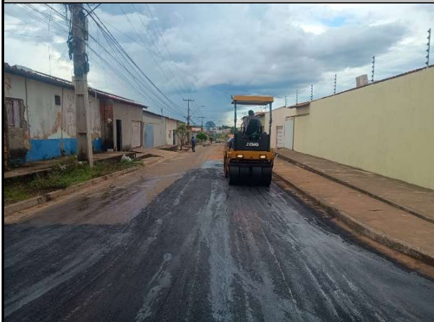
RUA PADRE ANCHIETA - 15/05/2026