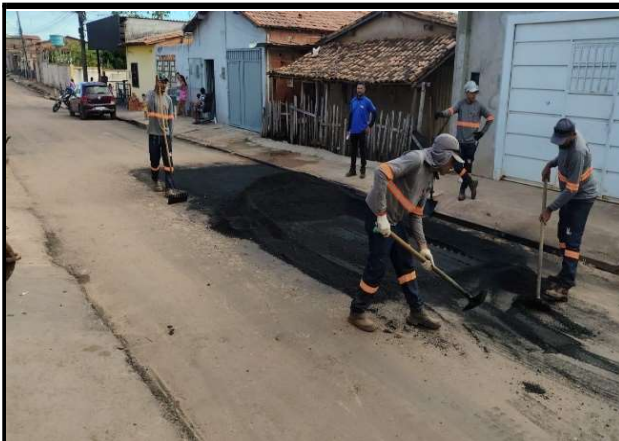
RUA 11 - 28/05/2026