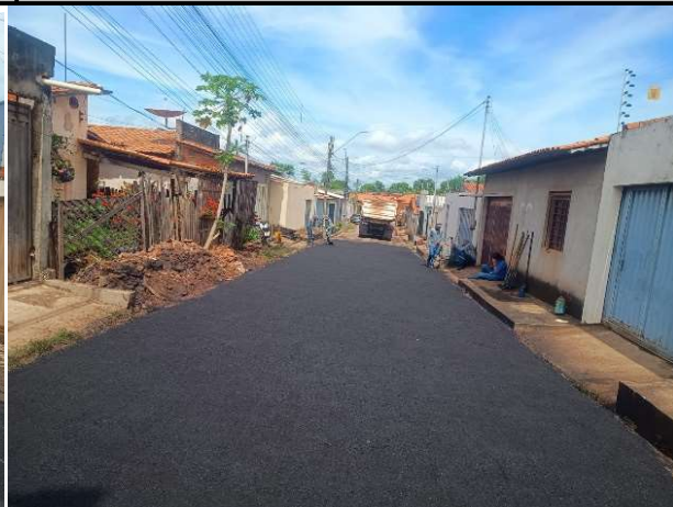
RUA SÃO JOSE - 13/05/2026