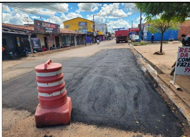
AV IMPERATRIZ - 06/05/2026