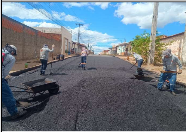
RUA TIRADENTES - 29/05/2026