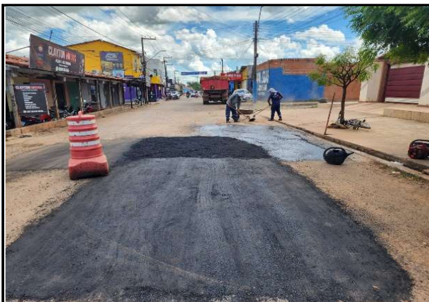
AV. IMPERATRIZ - 06/05/2026