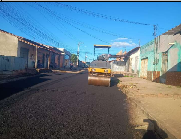
RUA TIRADENTES - 26/05/2026