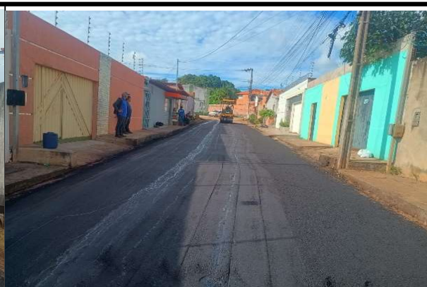
RUA SÃO JOSE - 11/05/2026