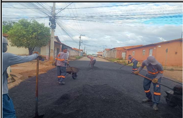
RUA TIRADENTES - 28/05/2026