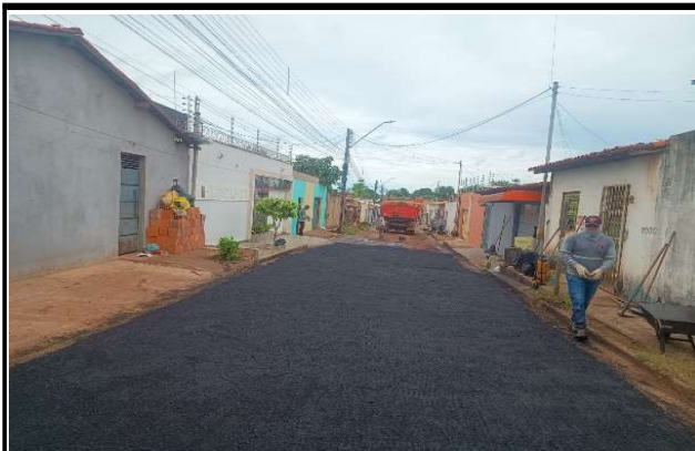
RUA SÃO JOSE - 11/05/2026