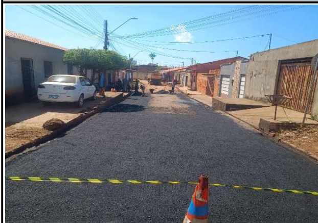
RUA SÃO JOSE - 06/05/2026