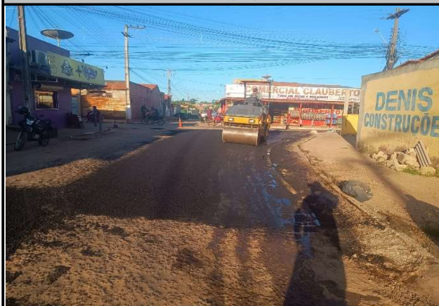
RUA TIRADENTES - 21/05/2026